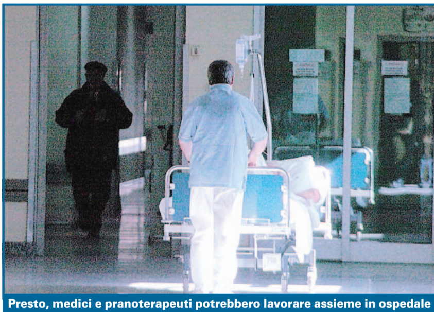
Presto, medici e pranoterapeuti potrebbero lavorare assieme in ospedale